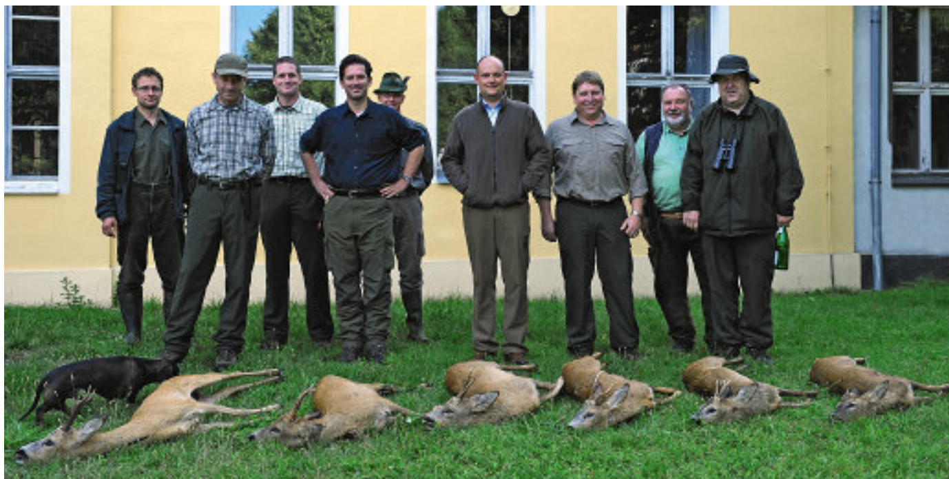
Waidmannsheil: Jagdgäste, Hausherr und Mitarbeiter freuen sich im Ehrenhof von Schloss Blumberg über einen Teil der Strecke.

Beim nächsten Ansitz jage ich in einem Revierteil mit ganz anderem Charakter und hoffe auf Rotwild. Eintönige Kiefernwälder, der eine oder andere Fichtenbestand, ausgeprägte Sandböden – mir