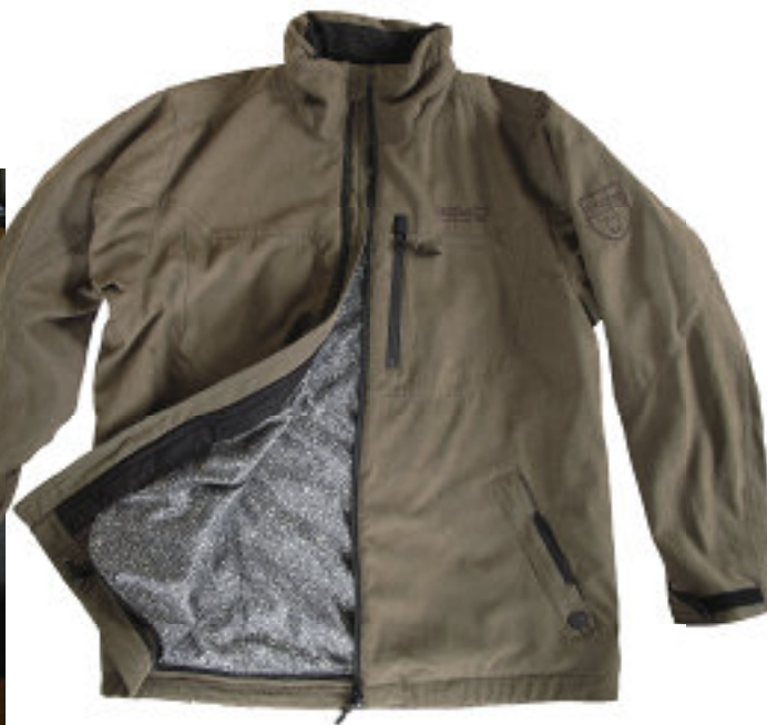
Der Stoff, aus dem der Filter ist: Aktivkohlekügelchen (l.) werden auf einen Trägerstoff laminiert und beispielsweise in der Outfox-Softshelljacke verwendet.

einer Kooperation mit K&K-Premium Jagd wurde ein speziell auf Blumberg abgestimmtes Intervalljagd-Konzept mit acht Jagdwochenenden im Jahr entwickelt. Dabei vermarktet der Jagdanbieter Einzelabschüsse aller Schalenwildarten sowie eine großangelegte Drückjagd für zahlende Gäste. Das restliche Jahr über herrscht komplette Jagdruhe.