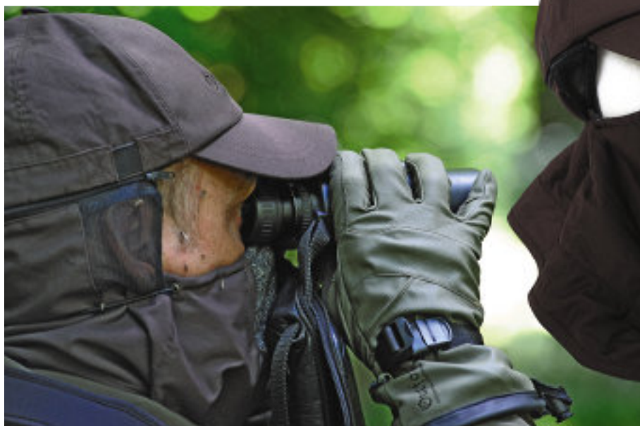
Gesichtsmaske mit Ergotarnfilter: Den kompletten „Mückenfilter“ gibt es aber noch nicht (l.).

Nach einer Viertelstunde wechseln wir den Stand. Schemenhaft erkennen wir ein vertrautes Kitz, aber auf den Rickenfiep erhalten wir keine Reaktion. Anscheinend sind Ricke und Bock im nahen Feld unterwegs. Kein Wunder, der von dort hereinwehende Wind bringt etwas Abkühlung und verscheucht die