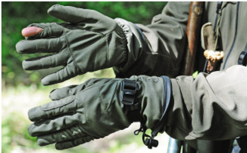
Aus dem Reitbereich: Griffige Sommerhandschuhe mit beiderseitigen Schießfingern.

Hergestellt werden diese Filter beim Mutterunternehmen von Outfox, der Blücher GmbH im brandenburgischen Premnitz, die das gleiche System in Kampfanzüge des US-Militärs einbaut, um Soldaten vor biologischen und chemischen Kampfstoffen zu schützen. Und was von außen nichts reinlässt, lässt auch von innen nichts raus, dachten sich Kai-Uwe Kühl und Hubertus v. Knigge und stellten Out-