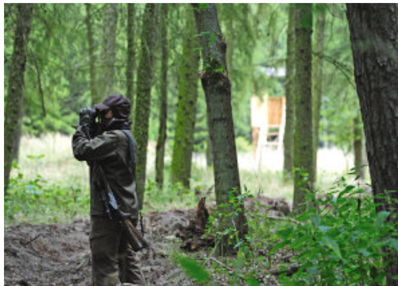
Vertraut: In Anblick kam weibliches Muffelwild (l.). Auch ohne Tarnaufdruck fühlte man sich bei der Pirsch immer gut getarnt (r.)

dung möglichst geruchsneutral, empfiehlt der Vertreter.